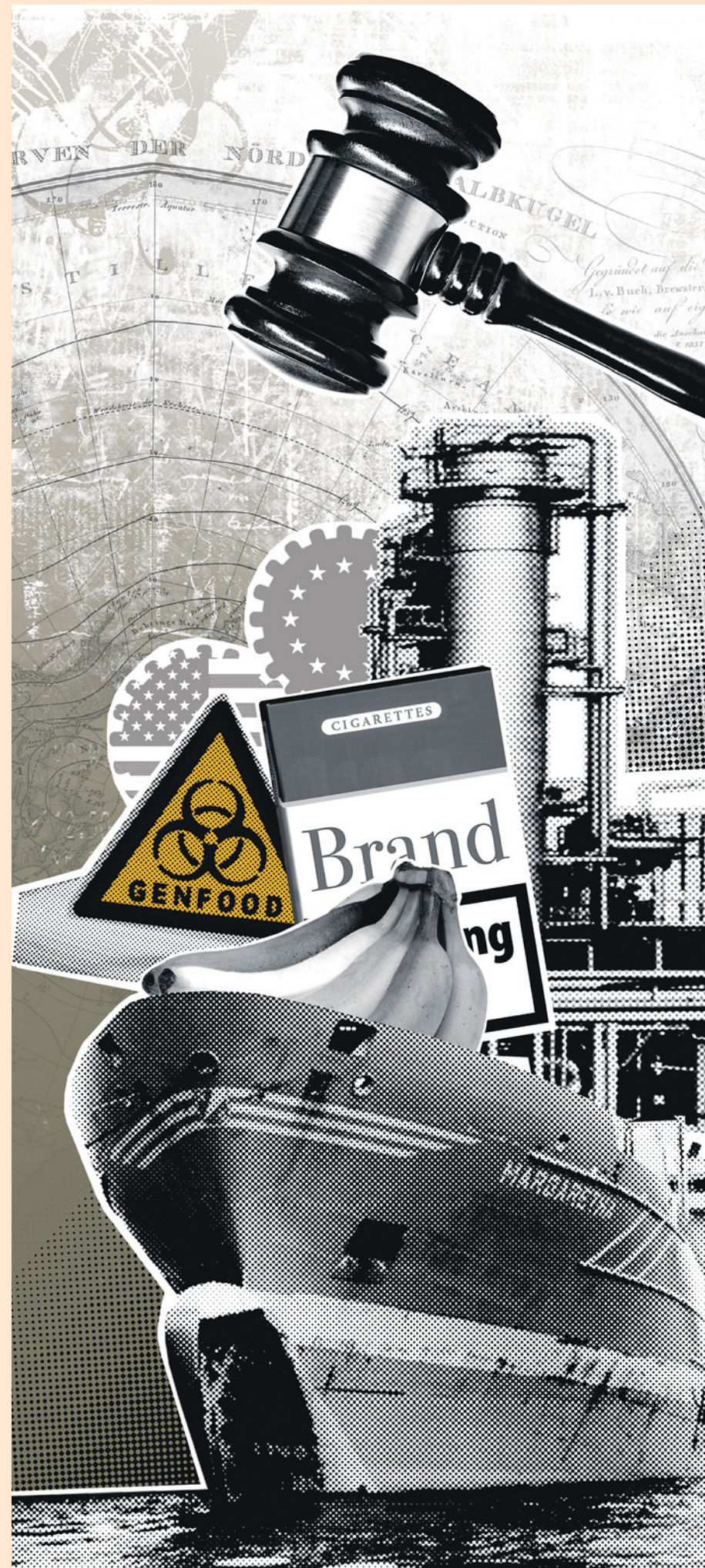
ILLUSTRATION: P. M. HOFFMANN

• Der US-Chemikalienhersteller Ethyl klagte Kanada, weil das kanadische Parlament einen giftigen Manganzusatz für Benzin verbot, den Ethyl standardmäßig verwendete. In der Diversion zahlte Kanada elf Millionen Dollar Schadenersatz und nahm das Gesetz zurück. • Metalclad klagte den Staat Mexiko, weil die US-Firma eine Mülldeponie auf einem Trinkwasserreservoir nicht betreiben durfte. Man hatte zwar die Unterstützung der mexikanischen Zentralregierung erhalten – allerdings ohne die Zustimmung der Kommune, auf deren Territorium die gesundheitsschädliche Anlage gebaut wurde. • Ecuador kündigte einen Ölfördervertrag mit Occidental Petroleum, weil der US-Konzern die Lizenz weiterverkauft und damit gegen ecuadorianisches Recht verstoßen hatte – was das ICSID-Gericht bestätigte.