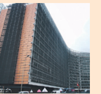
Berlaymont-Gebäude, Brüssel: Hier, am Sitz der Europäischen Kommission, wird das TTIP verhandelt

Sie sind gute Vorsätze, beim soeben fertigverhandelten Handelsabkommen CETA mit Kanada gelang ihre Umsetzung jedoch höchstens teilweise: Von einer Berufungsinstanz ist in dem 1634 Seiten starken Vertrag nichts zu finden, Konzerne können weiterhin auf „indirekte“ Enteignung klagen. Ganz grundsätzlich aber ist ein zusätzlicher Rechtsschutz für Konzerne zwischen der EU und den USA der falsche Ansatz – zumindest solange die Menschenrechte, die Gesundheit, die Umwelt, die soziale Sicherheit und die Demokratie auf gleicher, internationaler Ebene völkerrechtlich nicht geschützt sind.